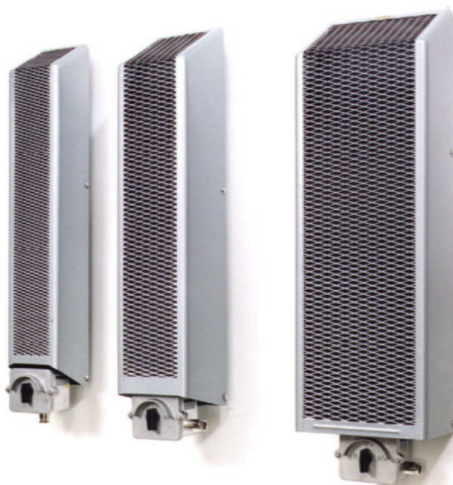
Abb./ photo: HWG500 HWG1000/1500 HWG2000